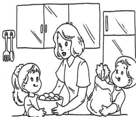
Norma del hogar