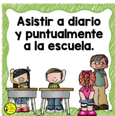
Normas de la escuela

Diferenciamos las normas que se deben cumplir en la casa de las que se cumplen en la escuela por ejemplo.