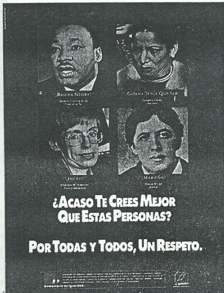
Afiche español destinado a la promoción de los Derechos Humanos, que apunta sobre todo a la no discriminación.

Desde el punto de vista jurídico, los Derechos Humanos son facultades o prerrogativas que las normas constitucionales e internacionales reconocen a las personas para asegurar su dignidad, respetar su libertad y garantizar un trato igualitario para todos. Si tales derechos no son respetados por el Estado o por otras personas o grupos, el titular de esos derechos puede exigir su cumplimiento, a través del ejercicio de la ley.