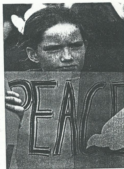
Un niño reclama por la paz en Irlanda del Norte.