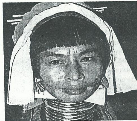
En algunos lugares del mundo las mujeres son obligadas a flagelar su cuerpo para adecuarse a las tradiciones de su comunidad.

Analicen a qué generación corresponden los derechos que aparecen violados o reclamados en cada una de estas imágenes.