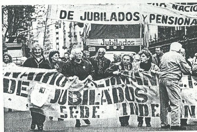
Marcha de jubilados en la ciudad de Buenos Aires.