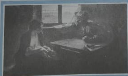
• Sin pan y sin trabajo (1892-93), óleo del pintor argentino Ernesto de la Cárcova

Tanto cualitativa como cuantitativamente, el desempleo en el modelo neoliberal revistió características inéditas, lo que nos permite suponer la existencia de causas que también lo sean.